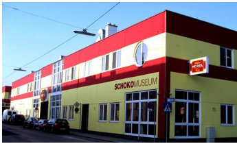
Abb. 1: Das HEINDL Schokomuseum

2006 übernahm die „Walter Heindl Ges.m.b.H.“ den bekannten und beliebten Waffel-Spezialisten PISCHINGER sowie die beiden dazugehörigen „United Chocolate“-Shops in der Wiener Innenstadt. Damit sicherte HEINDL nicht nur den Fortbestand einer der traditionsreichsten österreichischen Süßwarenmarken, sondern auch die Arbeitsplätze von rund 30 MitarbeiterInnen im Hause PISCHINGER. Im September 2012 erfolgte die offizielle Eröffnung der erweiterten und nunmehr doppelt so großen Firmenzentrale in Wien XXIII. Damit sind erstmals die beiden Produktionen von HEINDL und PISCHINGER unter einem Dach vereint.